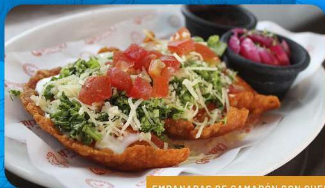
EMPANADAS DE CAMARÓN CON QUESO