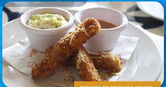
DEDITOS DE PESCADO CRISPY