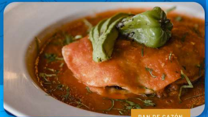
PAN DE CAZÓN