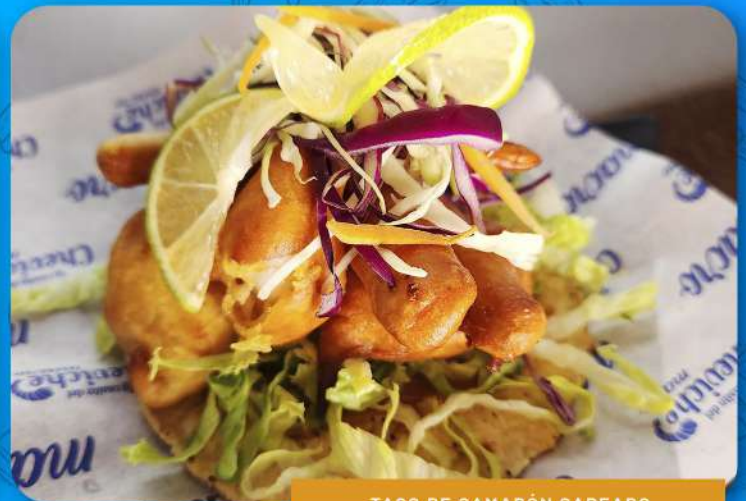
TACO DE CAMARÓN CAPEADO