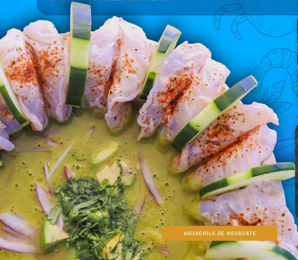
AGUACHILE DE AGUACATE