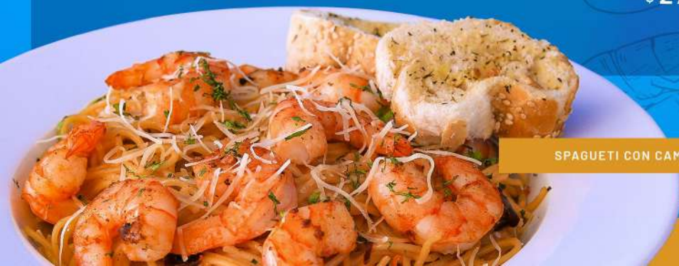
SPAGUETTI CON CAMARÓN A LA CREMA