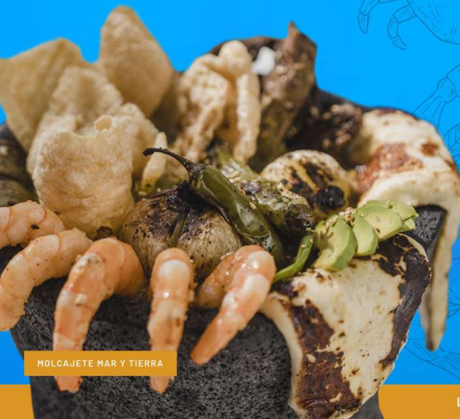
MOLCAJETE MAR Y TIERRA