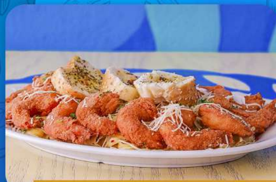
FETUCCINI ALFREDO CON CAMARÓN EMPANIZADO