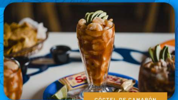
CÓCTEL DE CAMARÓN