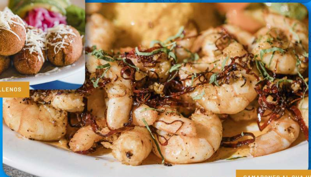
CAMARONES AL GUAJILLO