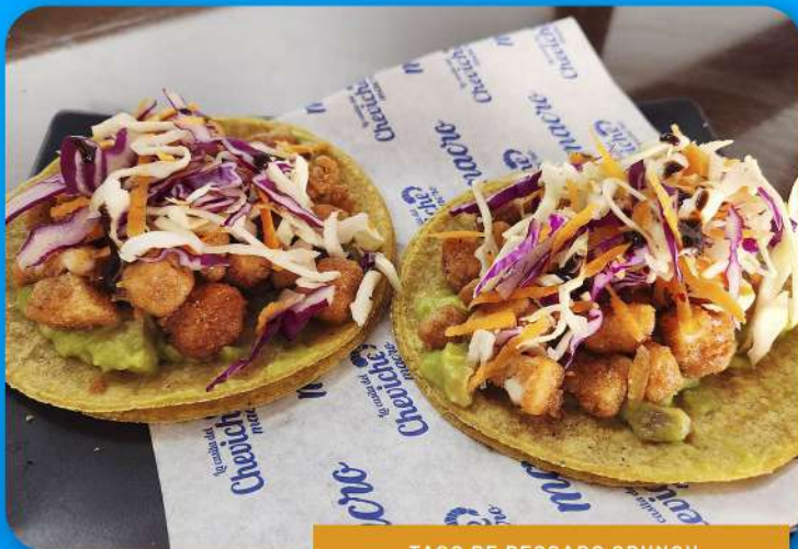
TACO DE PESCADO CRUNCH