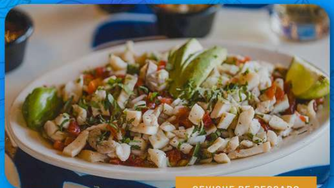
CEVICHE DE PESCADO