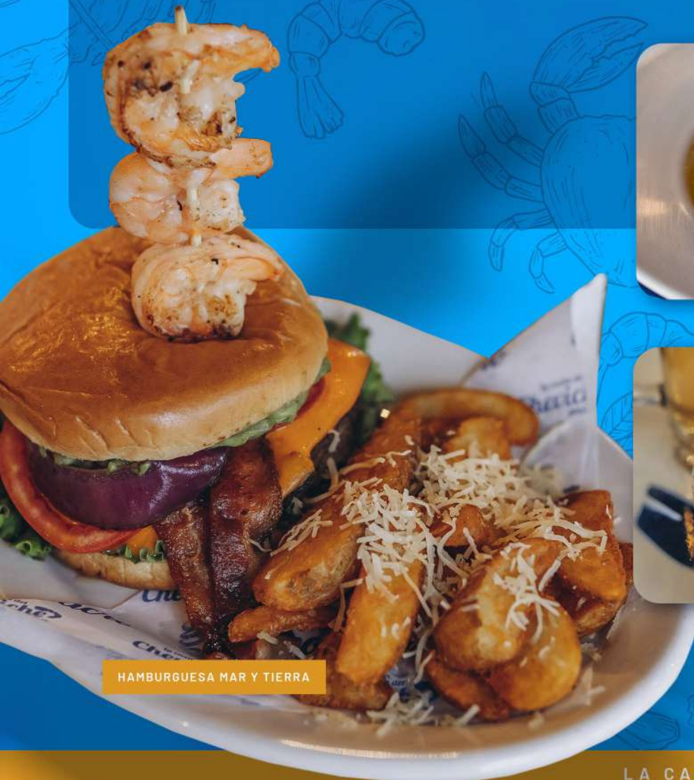
HAMBURGUESA MAR Y TIERRA