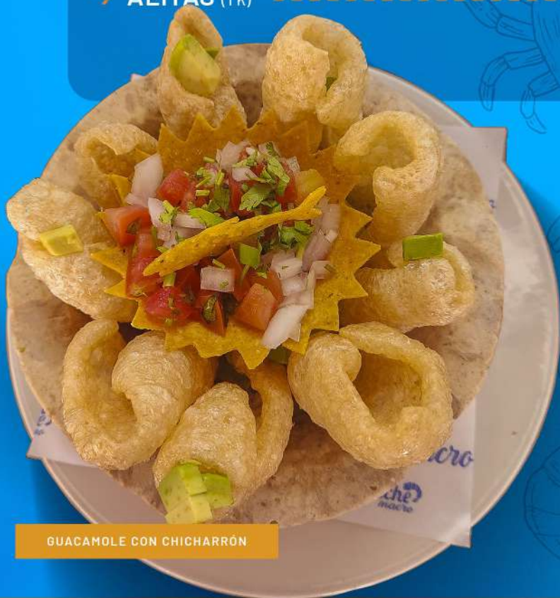
GUACAMOLE CON CHICHARRÓN