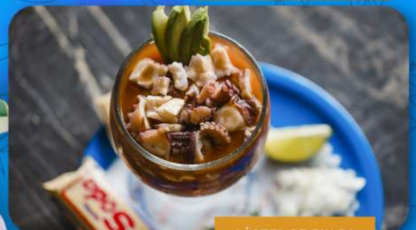
CÓCTEL DE PULPO